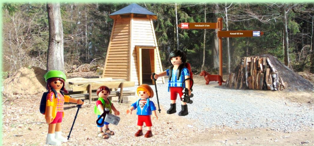
Schutzhütte Mooshäuschen mit Schaukohlemeiler am Wanderweg

Die Wanderstrecken sind 7 km und 12 km lang und ganzjährig geöffnet